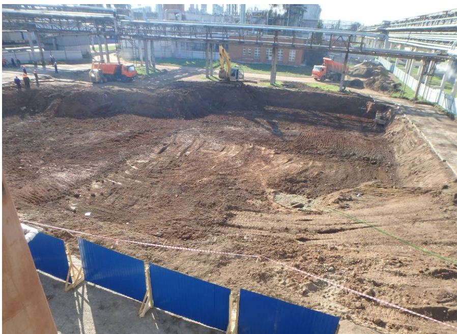
Рис. 5. Осмотр обнажений котлована на производственной площадке. Вид с севера.