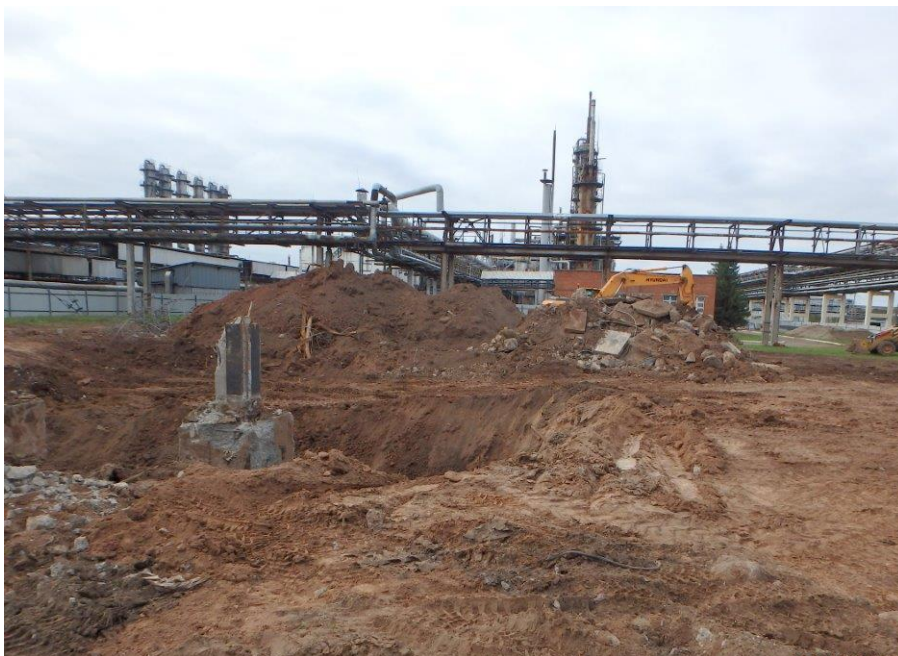
Рис. 3. Осмотр обнажений в зоне нивелировки и реконструкции существовавших твёрдых покрытий на производственной площадке. Вид с севера.