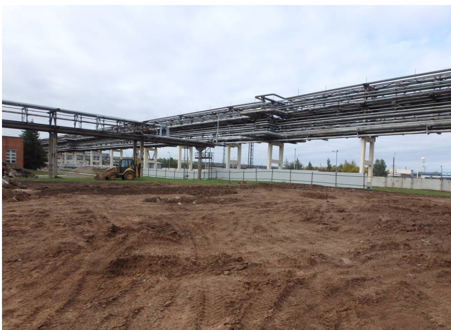
Рис. 4. Осмотр дневной поверхности северного сектора производственной площадки. Вид с северо-востока.